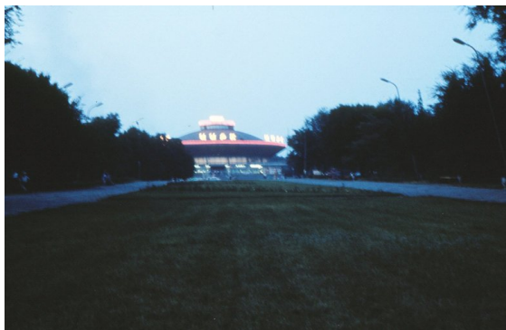
Cirkus v Záporoží