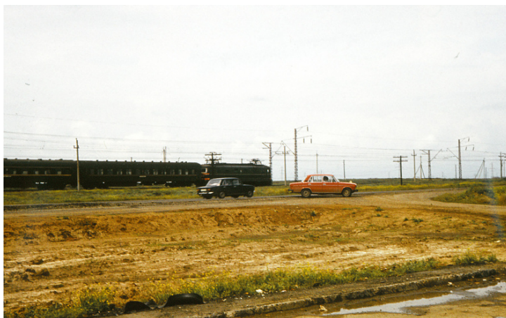
Cesta na Krym

Do teďka se nemůžeme dohodnout, jestli to, co jsme viděli i okusili, bylo jezero Sajka či už Azovské moře. Jisté je, že jsme zastavili a šli si umazat nohy do té vody. Bylo to tam velmi plytké a celý asi 500 m široký záliv se dal přejít, aniž bychom si namočili kolena. Dno i pláž byly z jílu, který byl měkký a mazlavý, takže se na něm mohlo klouzat. V moři (jezeru) se to trochu