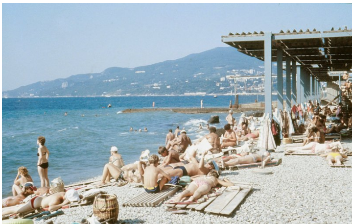
Pláž hotelu Jalta