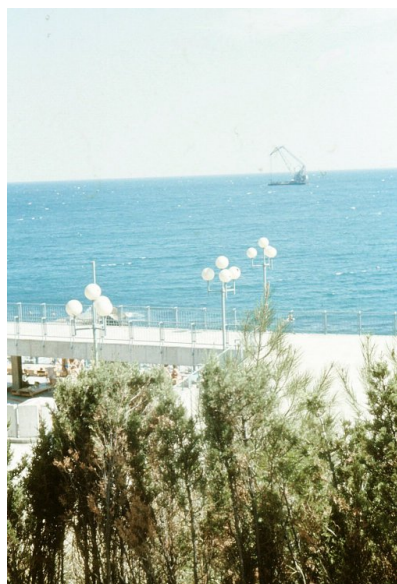
Pláž hotelu Jalta