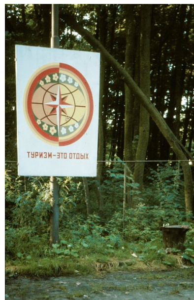
Vstup do kempu ve Lvově