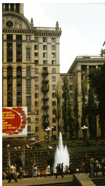
Kyjev – Kreščatik

zvyku, připomínky. Naštěstí se neprosadila. Nálada se z kritického bodu zvedla až při nájezdu na nám už známou cestu. Velmi se nám líbila JEDINÁ cedule směrem na kemp, která se zcela ztrácela v nakupení křížovatek. Vypadalo to jako provokace.